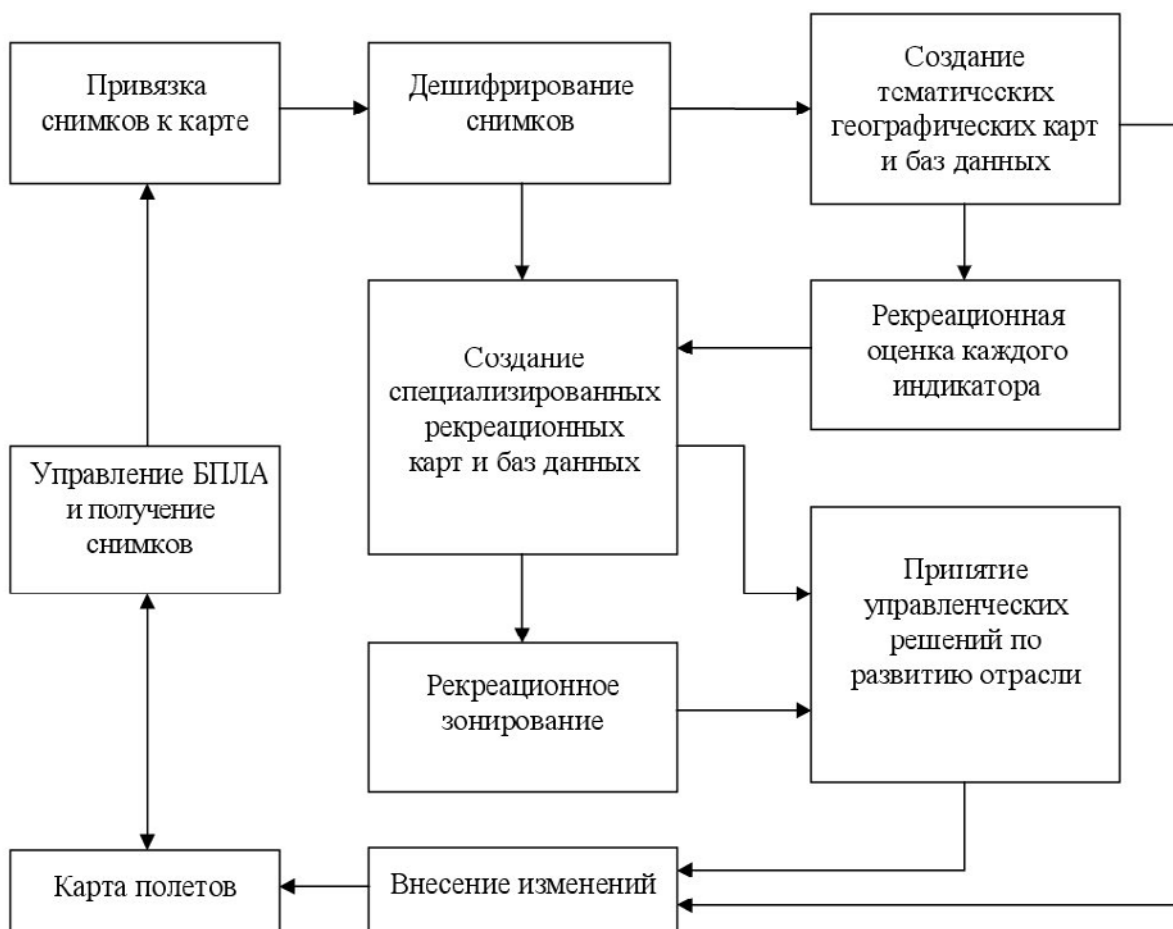
Рис. 1. Общая схема использования ГИС-технологий и беспилотных летательных аппаратов (БПЛА) в рекреационных целях

В настоящее время геоинформационные системы (ГИС) и аэро и фотосъемка активно используются в лесоводстве, что отражено в работах А.С. Исаева, М.Д. Брейдо, В.В. Фомина, Д.А. Старостенко, И.А. Вуколовой, Н.В. Малышевой, К.Н. Кулика, А.С. Рулева, В.Г. Юферова и других. Первой специализированной системой созданной для управления лесными землями была – FORESTER [1], а позже были созданы модули расширения для базовых геоинформационных систем (ArcGIS, MapInfo и другие) для решения задач по учету и управлению ресурсами [2, 3, 4, 5]. Но, несмотря на все многообразие ГИС, они практически не используются в географическом изучении рекреационных ресурсов, хотя и рассматриваются в качестве основного инструмента развития туристической индустрии.