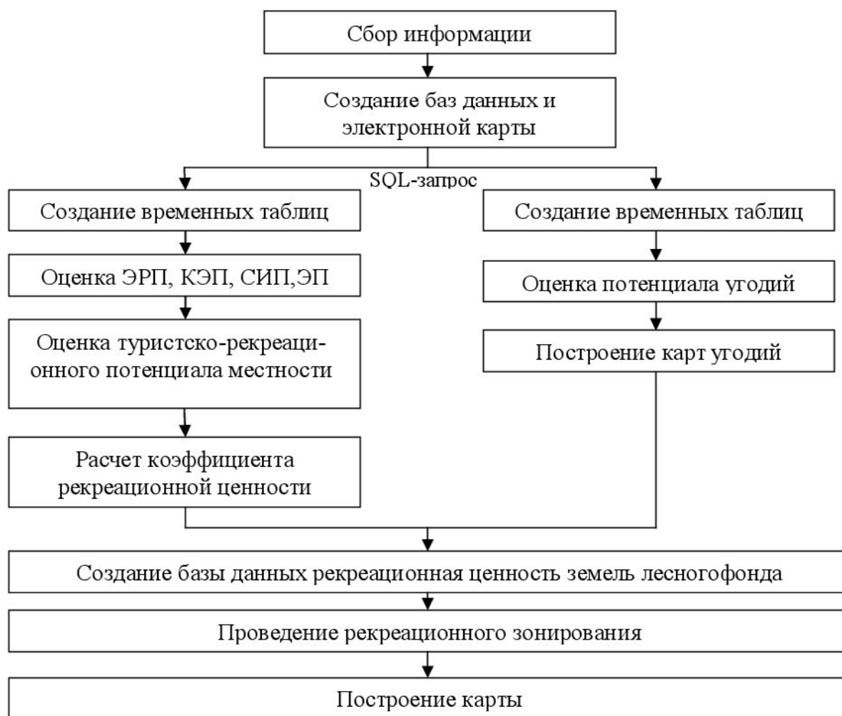
Рис. 3. Структурно-логическая модель рекреационной оценки земель лесного фонда Fig. 3. The structural and logical model of recreational assessment of forest grounds

Рекреационная оценка лесных территорий позволит учитывать состояние и возможности использования зеленых зон для восстановительно-оздоровительных целей, и выступит в