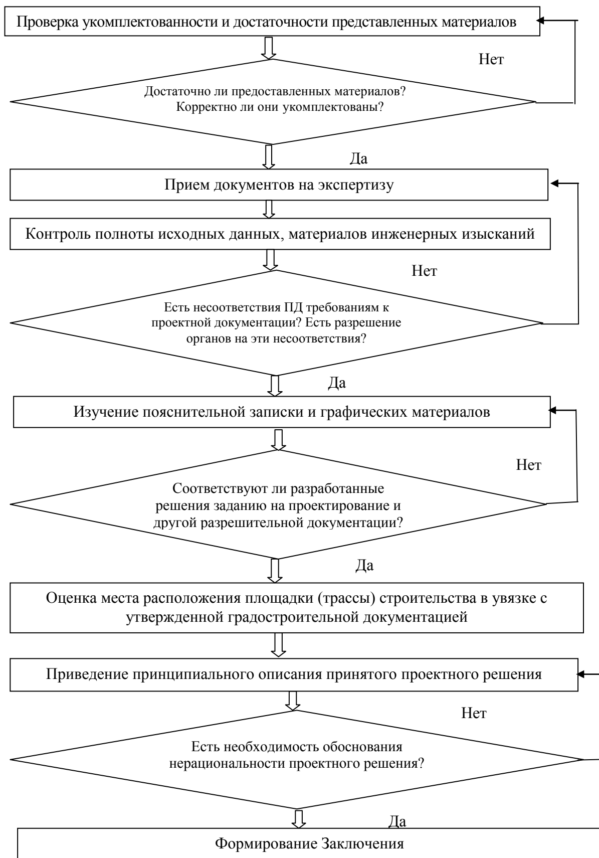
Рис. 1. Алгоритм проведения негосударственной экспертизы проектной документации