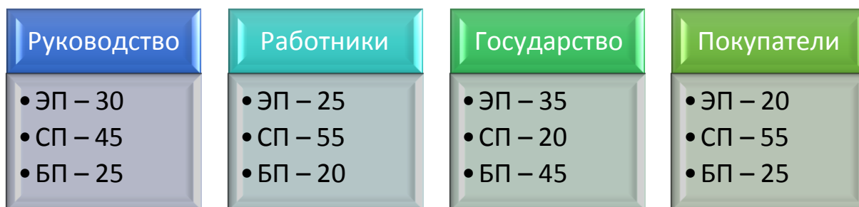
Рис. 1. Доли значимостей показателей по данным стейкхолдеров Fig.1. Proportion of the indicators' significance according to stakeholders

Далее по каждой группе стейкхолдеров рассчитывается частный интегральный показатель уровня социальной отдачи бизнеса по формуле 1.