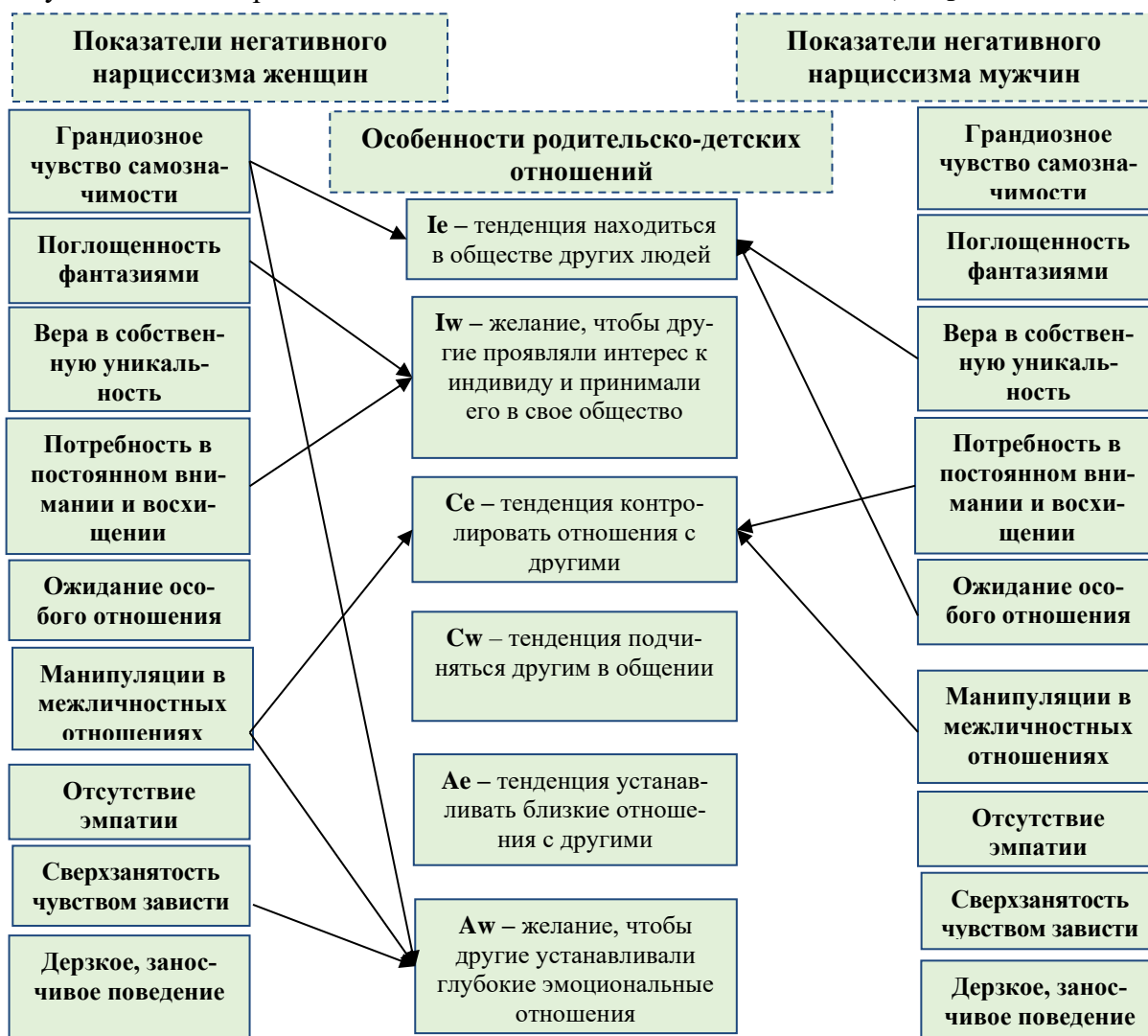
Рис. 2 Влияние показателей негативного нарциссизма супругов на отношения с их детьми

ном внимании и восхищении» значимо влияет на широкий диапазон отношений с партнером через устойчивое желание повышенного интереса к себе от супруга (Iw, p=0,027 ); проявление высокого контроля отношений с ним (Ce, p=0,019 ); тенденции снижения близости с мужем и требования инициативы от него (Ae, p = 0,029 );