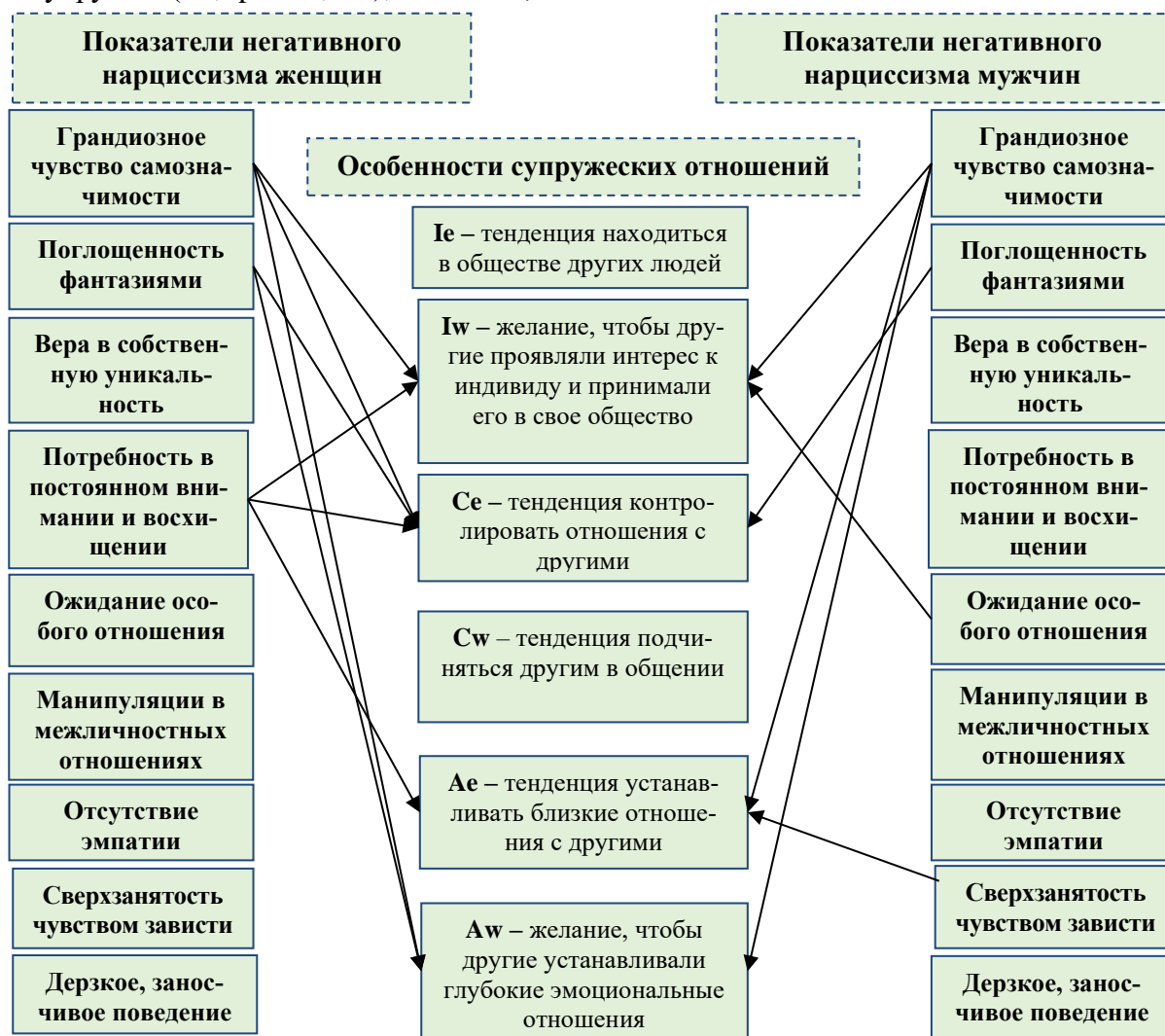
Рис. 1 Влияние показателей негативного нарциссизма супругов на отношения между ними

чтобы партнер стремился к установлению глубоких эмоциональных отношений ( A_w , p = 0,022 ). Этот показатель у мужчин также имеет существенное влияние на построение отношений и проявляется в наличии желания у мужа повышенного интереса к себе и учета его особенностей в отношениях со стороны супруги ( I_w , p = 0,019 ); в тенденции установления близких отношений с другими ( A_e , p = 0,017 ); в наличии желания готовности супруги на глубокие эмоциональные отношения ( A_w , p = 0,024 ).