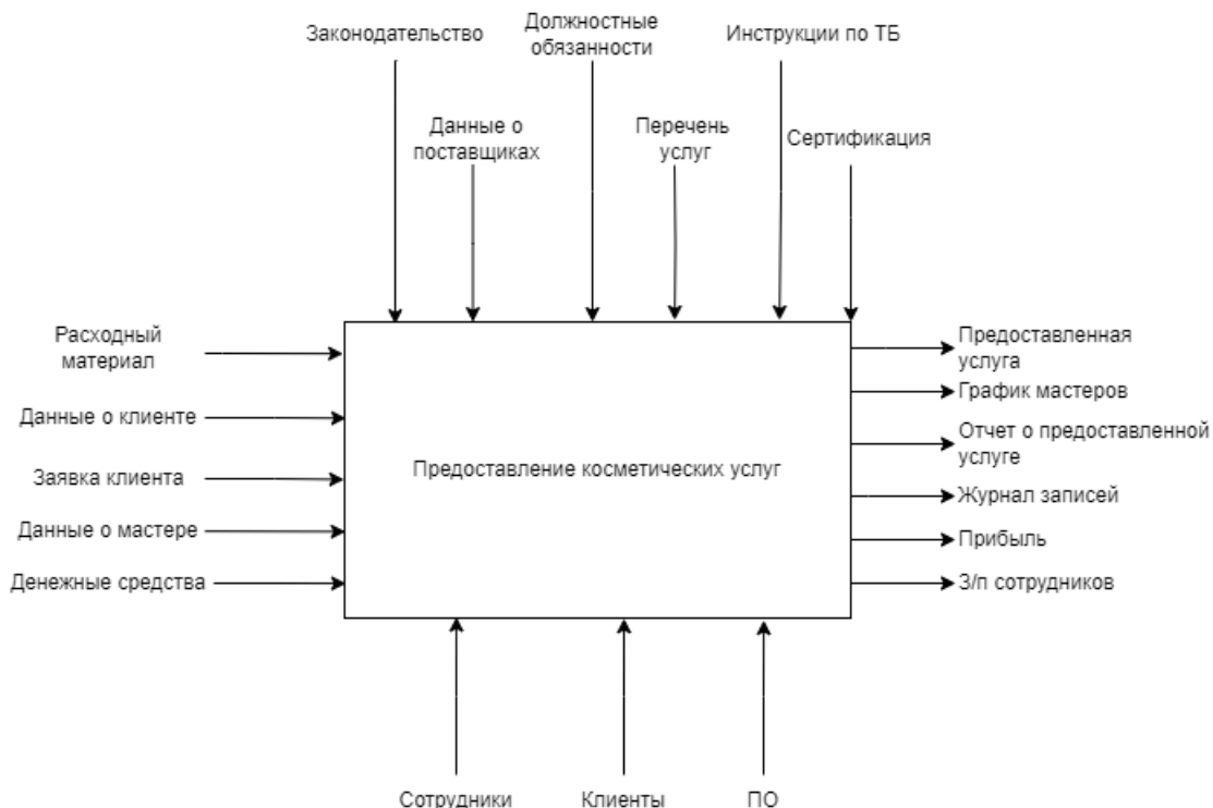
Рис. 2. Общая функциональная модель IDEF0 процесса «Предоставление косметических услуг» Fig. 2. General functional model IDEF0 of the process "Provision of cosmetic services"

На рис. 2 представлена общая функциональная модель IDEF0 процесса «Предоставление косметических услуг», которая отражает общий принцип работы салона красоты.