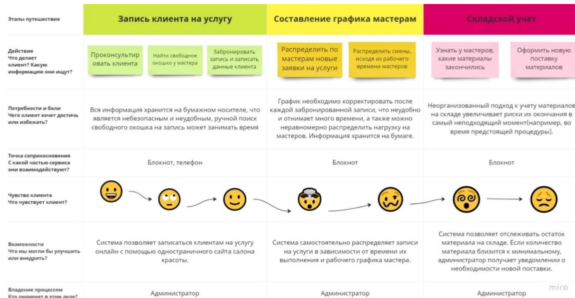
Рис. 4. Customer Journey Map администратора салона красоты в процессе выполнения своих обязанностей