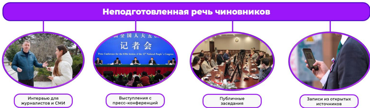
Рис. 2. Схема с используемыми ресурсами неподготовленной речи чиновников Fig. 2. A diagram with the resources used for the unprepared speech of officials

На Рисунке 3 представлена классификация вопросов, которые используются в дальнейшем анализе видеофрагментов из выступлений госслужащих: