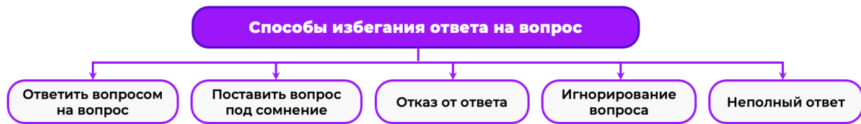
Рис. 5. Схема со способами избегания ответа на вопрос Fig. 5. A diagram with ways to avoid answering the question

Разрабатываемый алгоритм выявления уклончивости в ответах представляет собой сложную систему, основанную на двух обученных моделях, представляет собой обобщенный подход, который может использоваться для анализа диалогов или речи спикера.