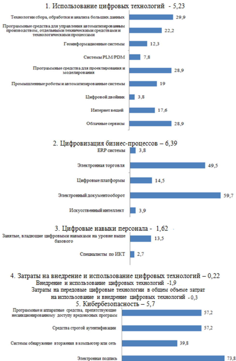
Рис. 3. Показатели уровня цифровизации предприятий обрабатывающей промышленности РФ в 2021 г. (составлено авторами по (Индекс цифровизации..., 2023; Индикаторы ..., 2022; Цифровая экономика, 2023))