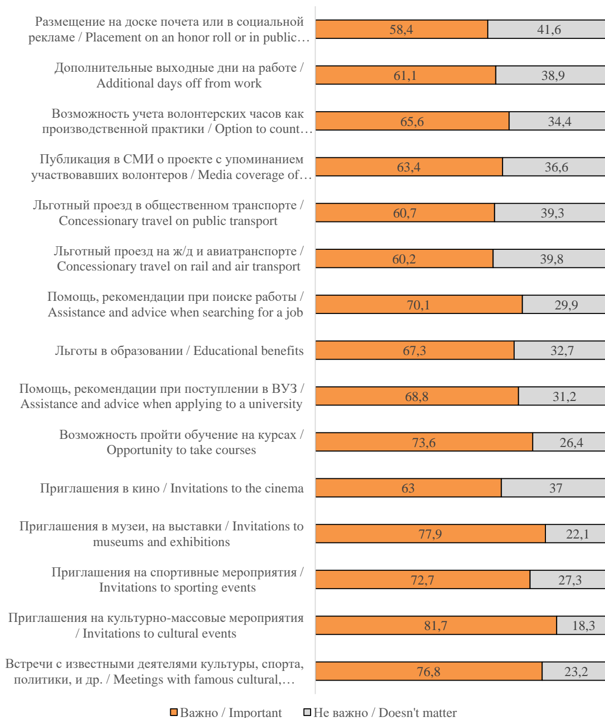
Рисунок 5. Ответы респондентов на вопрос: «Как Вы считаете, какие способы поощрения важны для таких волонтеров, как Вы?», % Figure 5. Respondents' answers to the question: "What types of rewards do you think are important for volunteers like you?", %

Второй уровень представлен смешанной группой, где доминируют инвестиционные формы (обучение,