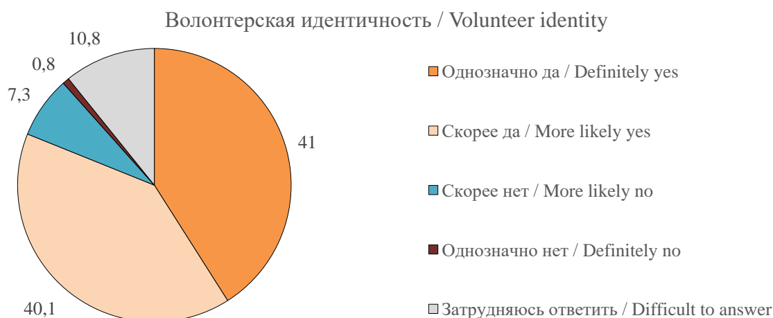
Рисунок 4. Ответы респондентов на вопрос: «Как Вы считаете, можно ли Вас назвать волонтером (добровольцем)»?», %