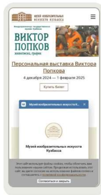
Рис. 2. Скриншот главной страницы сайта Музея изобразительных искусств Fig. 2. Screenshot of the main page of the Museum of Fine Arts website

Скорость загрузки сайта и с телефона, и с компьютера колеблется от 8 до 12 секунд.