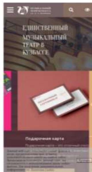
Рис. 1. Скриншот главной страницы сайта Музыкального театра, отображенный на экране телефона Fig. 1. Screenshot of the Musical Theatre's home page, displayed on a phone screen

составляет от 16 секунд на стационарном компьютере. На телефонах и планшетах скорость загрузки больше – 19 секунд, – открывается небольшая часть сайта – логотип, амбициозное заявление об уникальности театра и рандомное рекламное объявление (рис. 1).